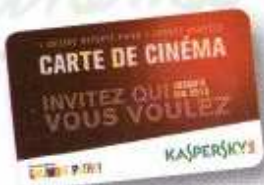
[ ] Carte Cinéma

4 Joignez à votre demande les pièces suivantes :