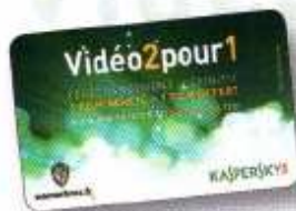
[ ] Carte Vidéo

3 Précisez le choix de la Carte 2 pour 1 souhaitée (un seul choix possible) :